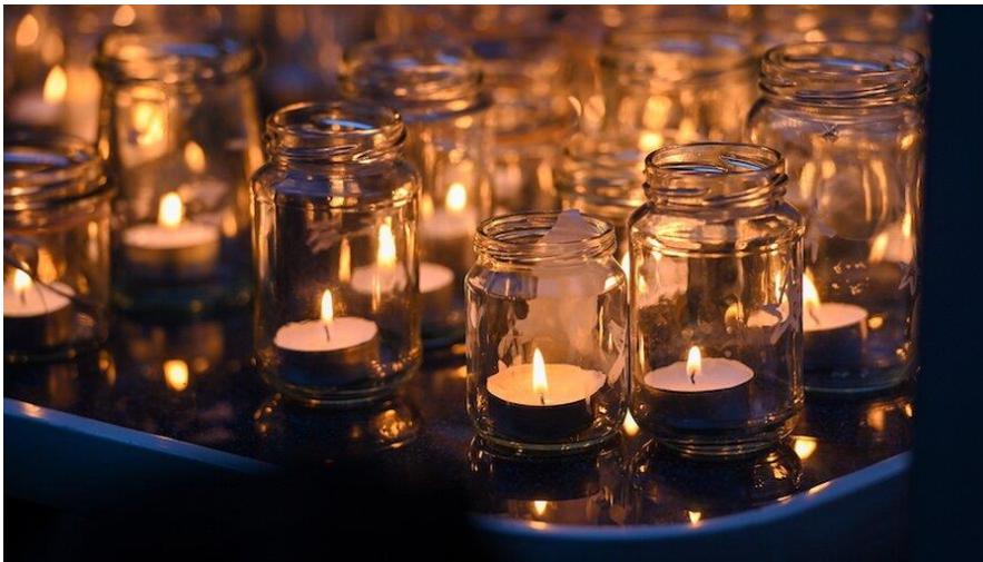
Kerzen mit dem Friedenslicht aus Bethlehem in einem Gottesdienst in Bonn

Das Friedenslicht aus Bethlehem ist seit 1986 ein weltweites Zeichen für Frieden. Vor 30 Jahren brannte es erstmals in Deutschland. In diesem Jahr war lange ungewiss, ob es in der Geburtsgrube entzündet werden kann.