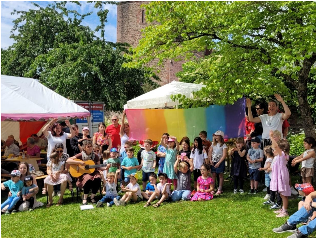
Kinder und Erzieherinnen der KiTa „Regenbogen“ bei ihrem bunten Auftritt