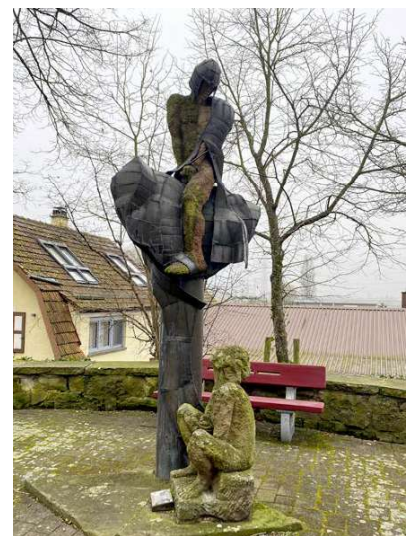
Martin und der Bettler. Skulptur vor der Kirche St. Martin in Forchheim.

Martin von Tours gehört zu den beliebtesten Heiligen in ganz Europa. Für die Pfarrei Ettlingen ist seine Wahl zum Kirchenpatron auch Programm, wie aus der Gründungsvereinbarung hervorgeht. Seinem Beispiel folgend steht die Pfarrei für die vorbehaltlose Begegnung mit den Menschen, für Menschenfreundlichkeit, die sich im Teilen zeigt und für die Hoffnung und Freude im Glauben.