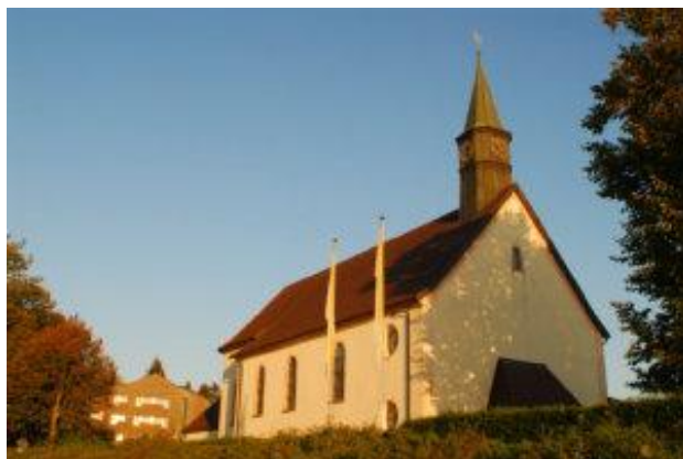
Bild: Wallfahrtskirche auf dem Lindenberg.

Die Betergruppe Karlsruhe/ Albtal/ Murgtal sucht neue Mitbeter für die Gebetswoche auf dem Lindenberg. Von Pfingstmontag bis Samstag sind wir zum Beten in der Gemeinschaft bei St. Peter versammelt. Unsere Gruppe umfasst ca. 20 aktive Männer mit einem Durchschnittsalter von ca. 70 Jahren. Neue Mitbeter sind herzlich willkommen. „Die Nähe Gottes spüren“ ist ein Hauptanliegen unserer Gruppe.